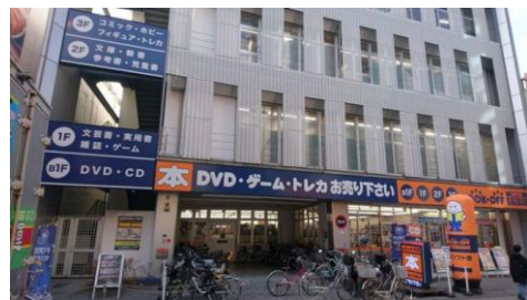
町田が誇る国内最大のブックオフスーパーバザー

月に1回、ポートビスでは企業見学会を開催しています！今回はブックオフの特例子会社「ビーアシスト株式会社」様を見学しました。ビーアシスト様では、障害のある社員も、店舗やインターネットで販売される商品の加工（商品として売り出す前のクリーニング作業）や商品補充など、健常者と同じ作業をしています。