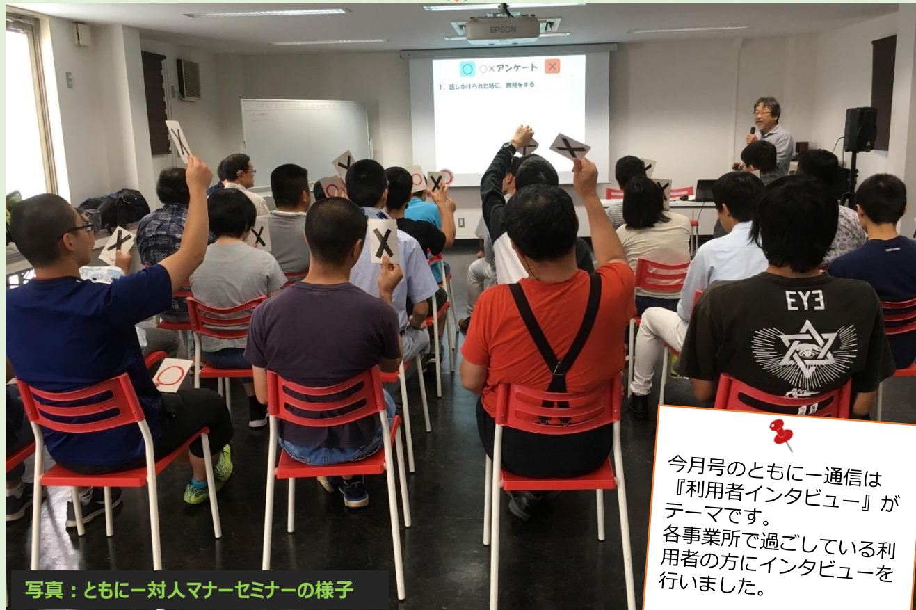
写真：ともしに一人対人マナーセミナーの様子

今月号のともしに一通信は『利用者インタビュー』がテーマです。各事業所で過ごしている利用者の方にインタビューを行いました。